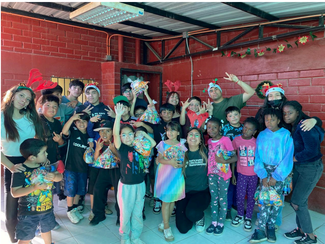
Actividad navideña Territorio El Jardín