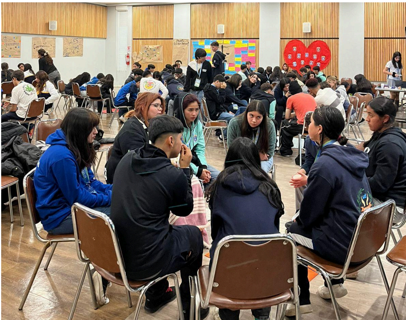
Colonias de Invierno.